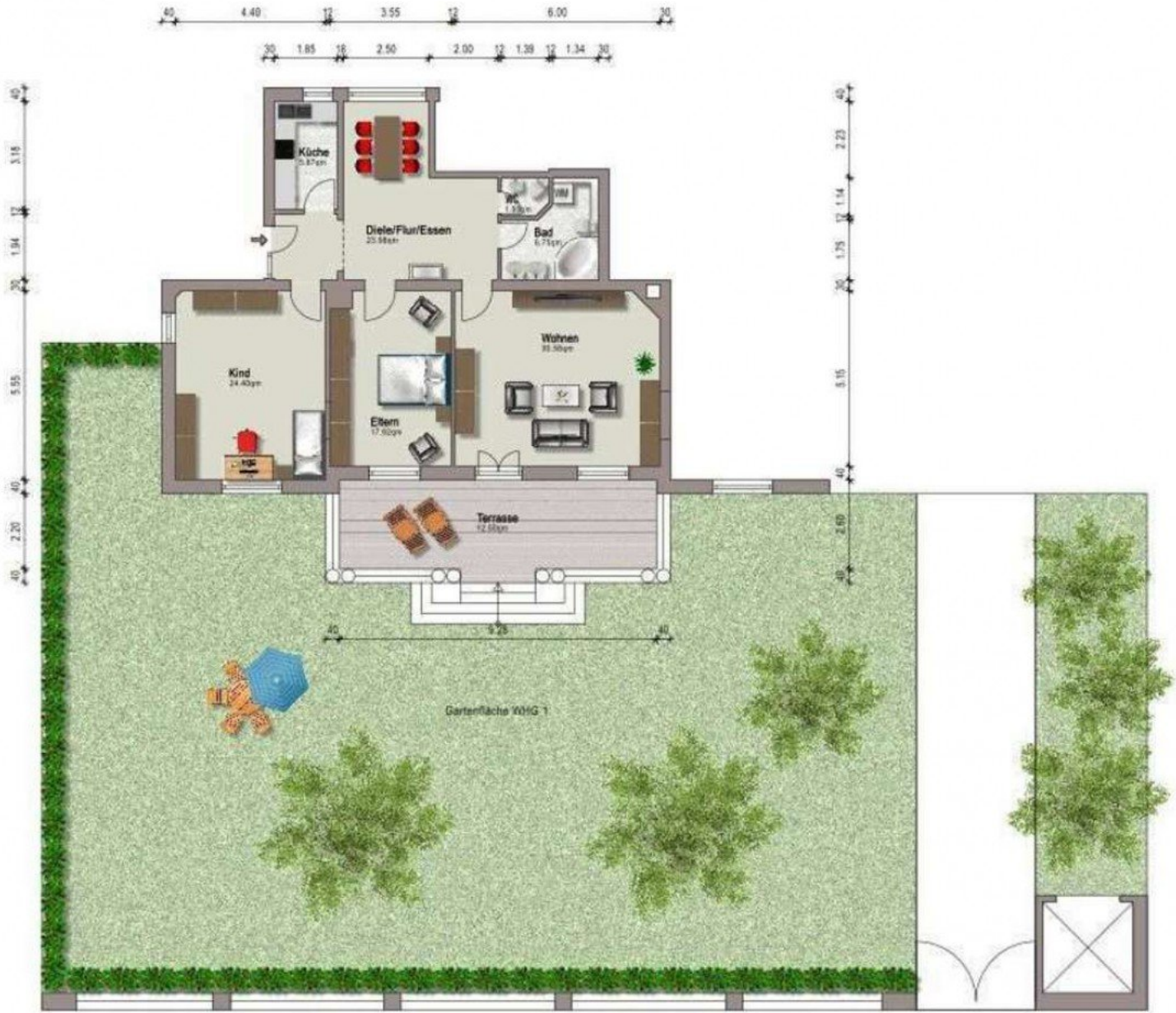
Grundriss mit Garten